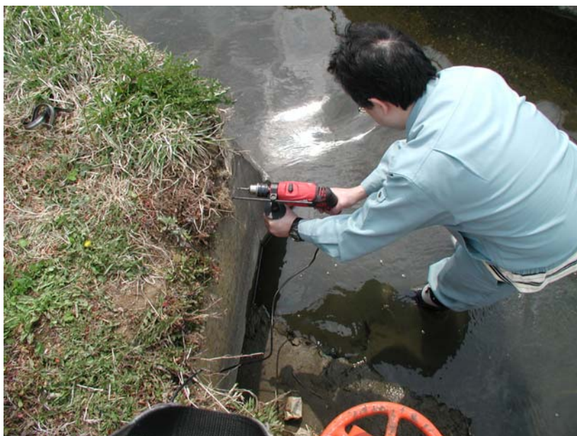
⑧ アンカーボルト用穴を穿孔中。