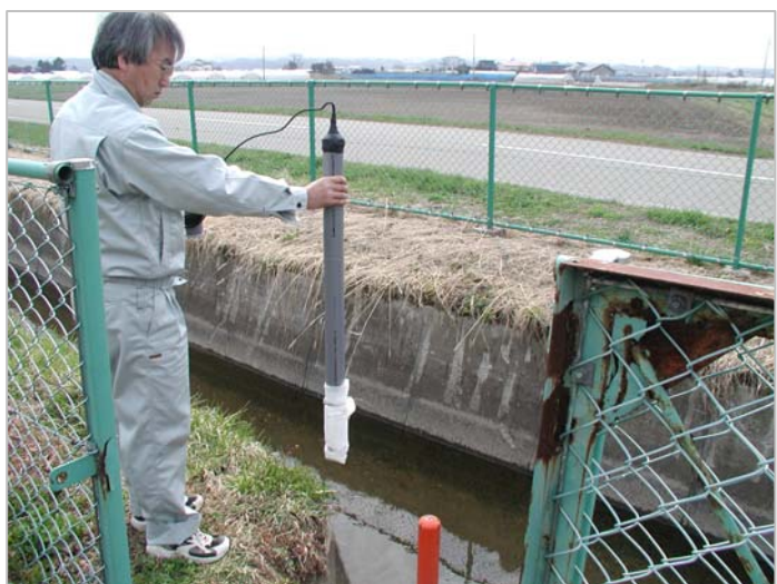
⑦ 1mの電極式センサー完成。