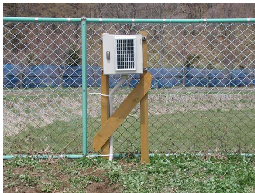
⑪ 完成 2