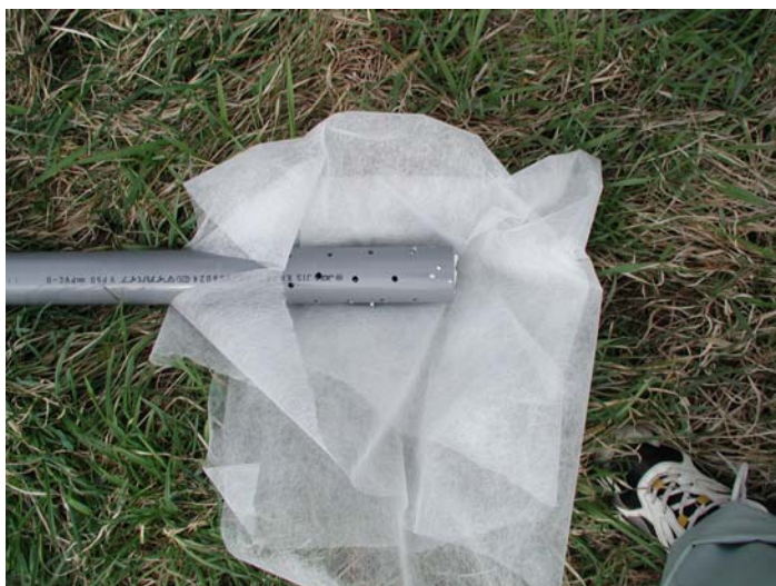
⑤ 防波管に穴をあけ、不織布にて保護。