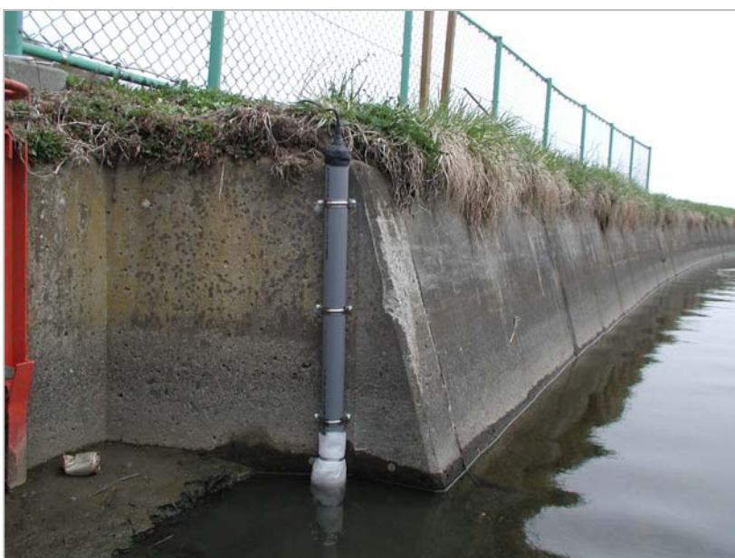
⑨ 垂直に設置することが必要です。 1 cmごとに電極が付いています。