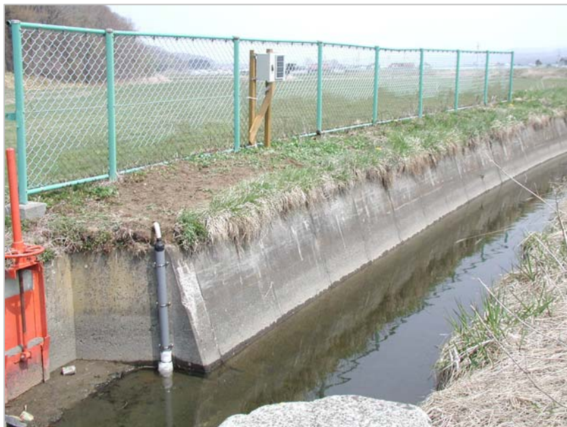
⑩ 完成 1